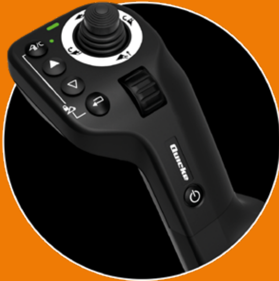
Q E -command