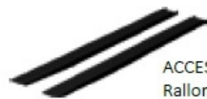
ACCESSOIRES : Rallonges de fourches